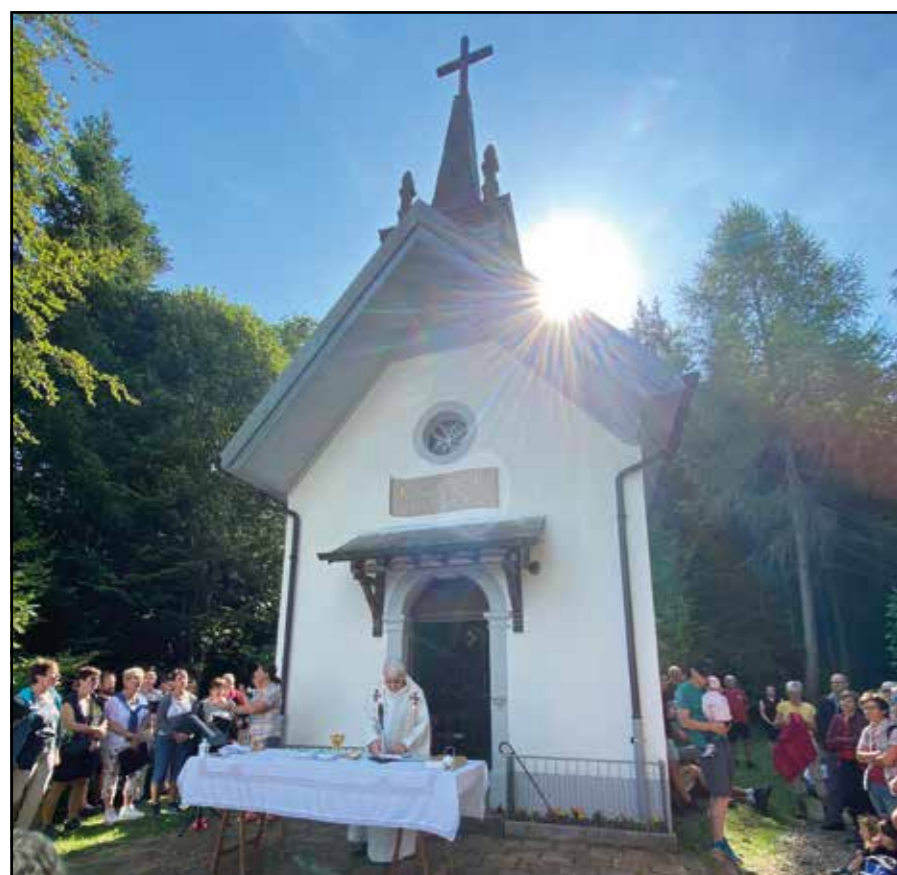
Chapelle du Niremont

Merci au Conseil de Paroisse pour l'organisation de cette journée et à Mecatal pour son expertise.