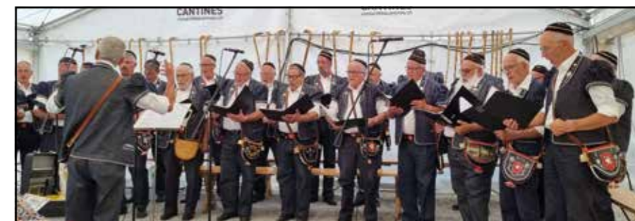
Confrérie du Gruyère, une prestation à la hauteur des attentes

vit». L'accueil des pèlerins, le beau temps, l'ambiance chaleureuse et surtout la messe suivie par un temps d'adoration à la grotte, nous ont enthousiasmés et ressourcés, comme l'ont exprimé les participants du Châ-