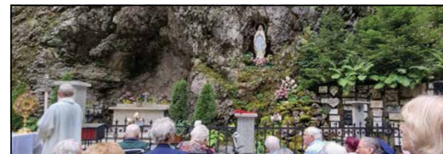
Grotte de Grandvillard

Le 15 août, jour de l'Assomption, « Notre-Dame » a été célébrée au pèlerinage de Grandvillard, avec quelques résidentes et résidents et effectivement, comme il était écrit sur l'affiche: « Grandvillard ne se raconte pas, il se