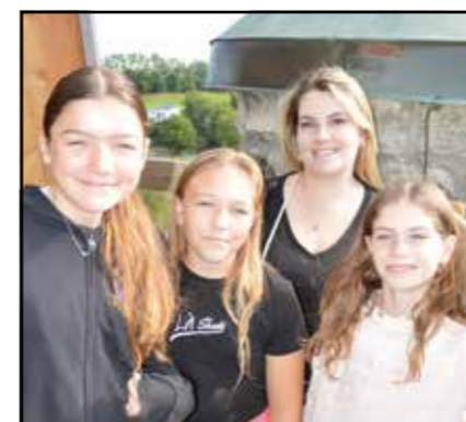
Servants de messe, septembre 2023