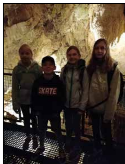
Le 1 er juillet course de l'UP à Vallorbe

bénéficier des moments de joyeuses rencontres.