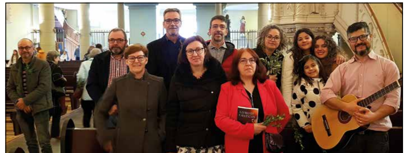
La chorale portugaise lors de la Messe des Rameaux à Attalens