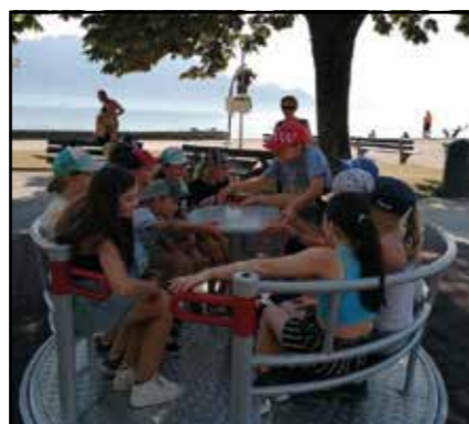
Le 22 août course de la paroisse à Sauvablin Et colore ta vie et bain

Nous invitons tous les enfants qui ont fait leur Première Communion à rejoindre le groupe des servants et vivre ensemble la messe en étant acteur et