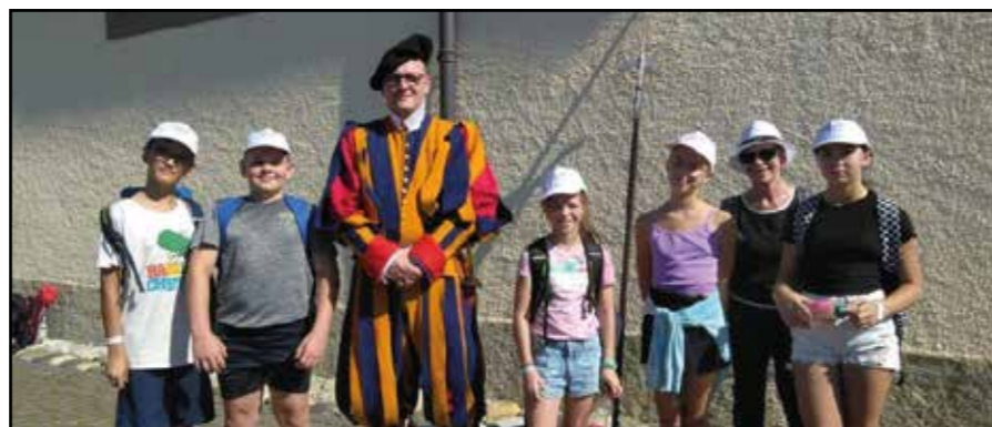
Le 9 septembre sortie cantonale à Siviriez

bénéficier des moments de joyeuses rencontres.