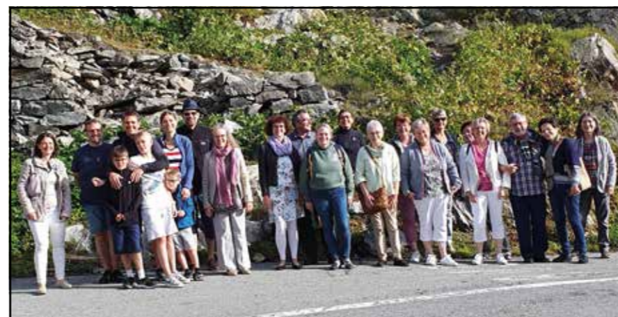
La Cécilienne au Grand-St-Bernard, septembre 2023