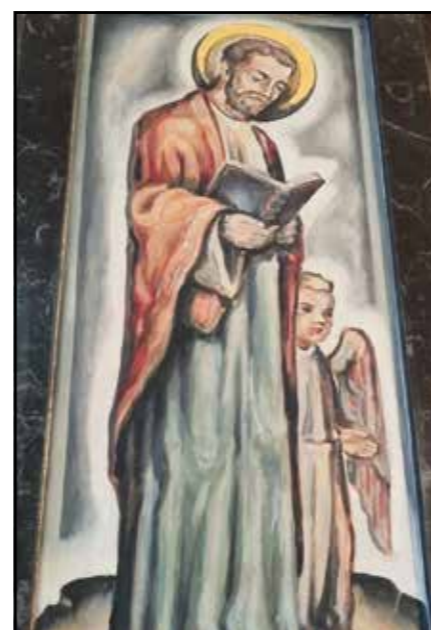
Saint Matthieu, église de Porsel

roi. Il est mort en l'an 61 en martyr car il défendit une vierge qui refusait de se marier avec le prince. Le prince le fit alors tuer pour cela. C'est ainsi que s'achève le portrait des évangélistes représentés dans l'église de Porsel. J'espère que mes textes vous auront plu et surtout permis d'en apprendre davantage sur cette thématique.