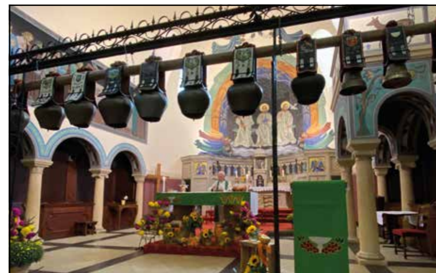
Semsales, Désalpe 2023