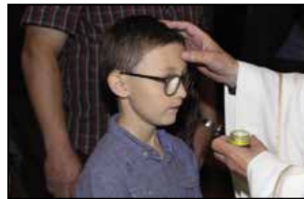
Semsales le 13 mai 2021