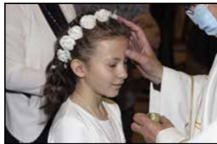
Semsales le 13 mai 2021