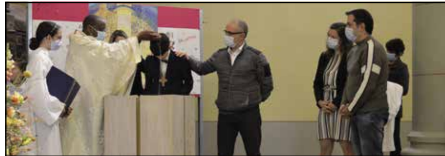
Attalens le 2 mai 2021