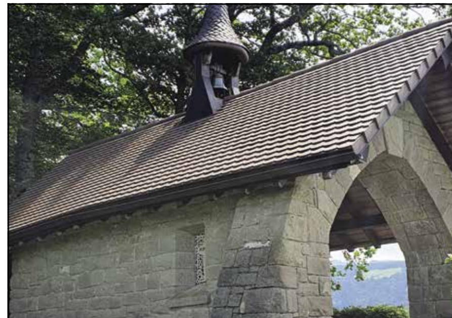
Chapelle du Jordil, vue extérieure