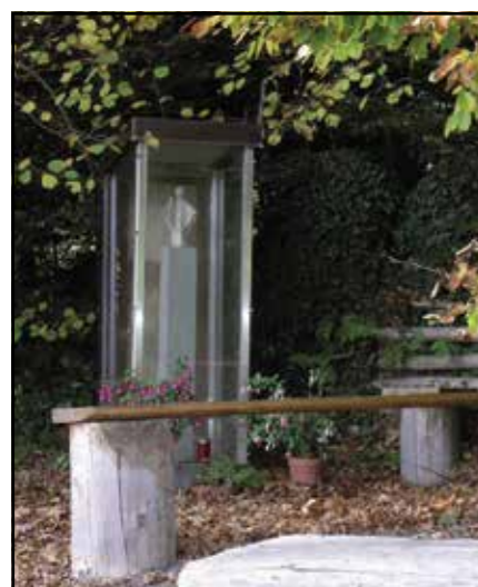
Oratoire de Besencens