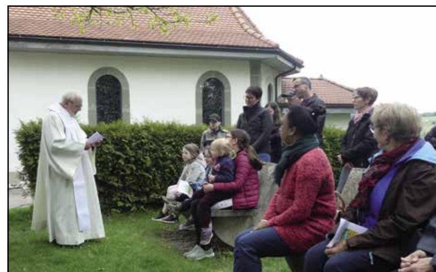
Notre-Dame du Bois