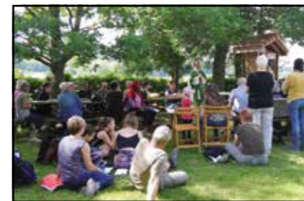
Messe à Notre-Dame du Bois

Tous les mardis du mois de mai, grâce à la météo plus que clémente de ce printemps, de nombreuses personnes se sont retrouvées pour assister aux messes célébrées à la grotte sous le regard attendri de la Vierge Marie.