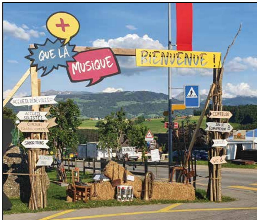
Entrée place de fête

De nombreuses photos sont consultables sur le site internet de la fête www.st-martin2022.ch . C'est donc la tête remplie de bons souvenirs que nous pouvons souhaiter bonne chance à la prochaine fanfare organisatrice, celle de la paroisse voisine de Porsel.