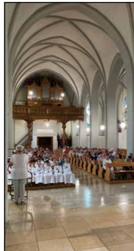
Messe de la Fête-Dieu