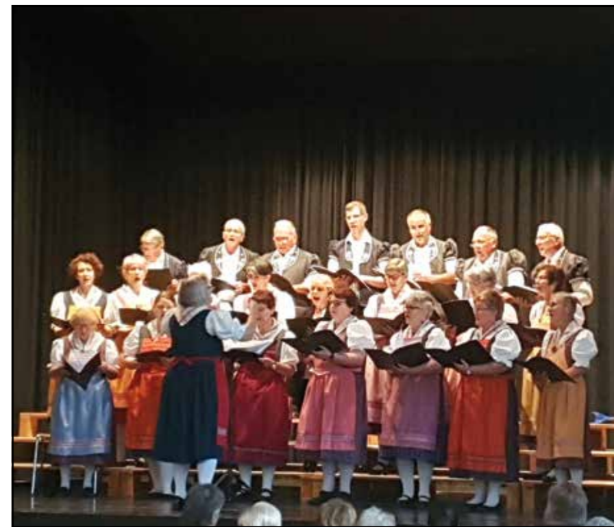
Concert du chœur mixte

Merci à vous chanteuses et chanteurs pour votre engagement!