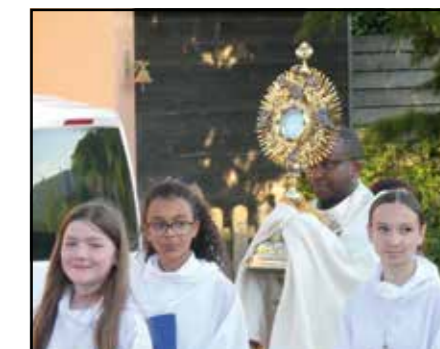
Fête-Dieu 2022, procession avec l'ostensoir