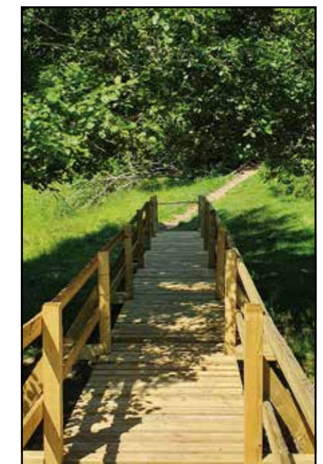
Sentier rand'eau rénové

La bènichon màrkè adon la fin di travô po ha dè chaptanbre è le rètouà di j'omo è di tropi apri on tsòtin pachâ a la montanye po la bènichon d'òktobre. Lè l'okajion po lè famiye, dè chè rètrouvà in yin è in lårdzo. On chè retravè ti outoua dè la trâbya po partadji on fameu goutâ.