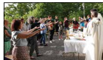
Le Groupe Samuel au moment du chant du Notre Père

Lors de cette assemblée, le budget relatif aux travaux du clocher et du frontispice de notre église a été accepté à l'unanimité.