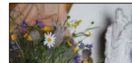
Les enfants ont déposé des fleurs des champs aux pieds de Notre Dame du Scé